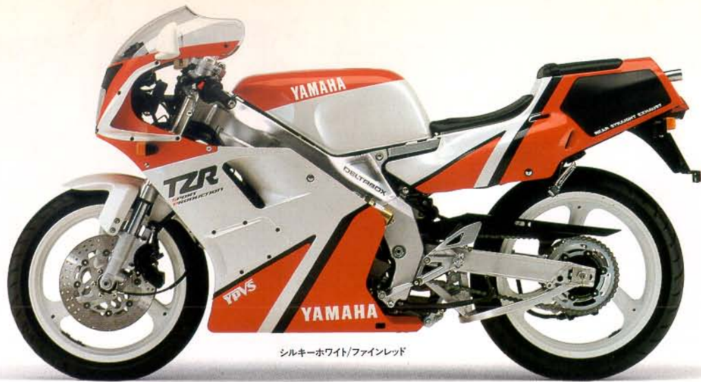
シルキーホワイト/ファインレッド